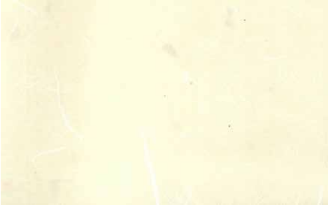
COLORE N° F (CREMA / PANNA)