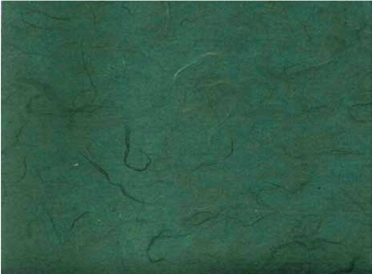
COLORE N° I (VERDE CHIARO)