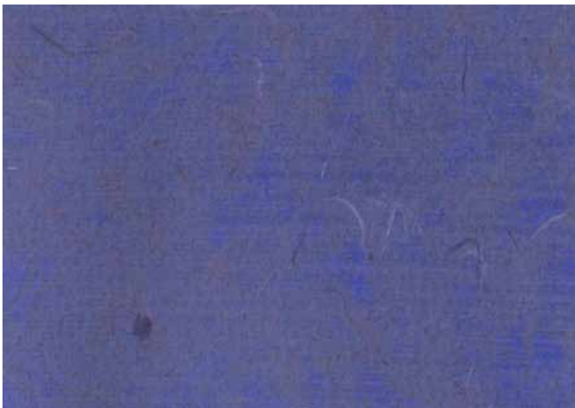
COLORE N° C (BLU CHIARO)