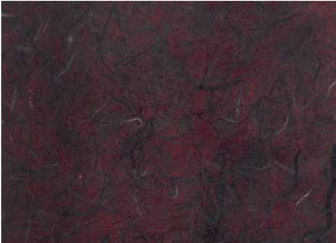
COLORE N° N (NERO SFUMATO ROSSO)