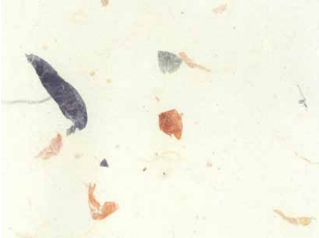
COLORE N° G (PANNA CON FOGLIOLINE SPARSE)